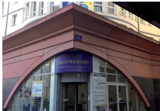
L'école ESCO Wesford Auvergne

Le 10 décembre dernier, ont été présentés à Paris, les résultats d'une enquête IPSOS concernant l'emploi des personnes handicapées en France (cf article 7) dotant ainsi le Club Handicap & Société d'un observatoire à vocation barométrique dans le but d'alimenter la réflexion. Le Club a également souhaité réaliser un focus régional de ce baromètre, en partenariat avec le MEDEF lyonnais, afin de munir la région Rhône-Alpes d'un observatoire sur l'état des lieux de l'emploi des personnes handicapées. Les résultats de cette enquête seront présentés devant l'ensemble des acteurs du handicap, qu'ils soient associatifs, politiques ou économiques, lors d'une conférence de presse au 2 ème trimestre 2015 à Lyon.