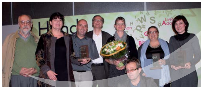
Les lauréats 2014

Pour obtenir les résultats du baromètre : contact@fondshs.fr