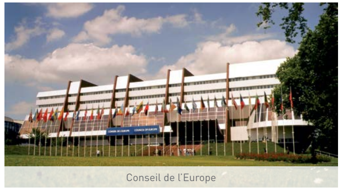
Conseil de l'Europe

AVANCEE ACTEURS CULTURE INCLUSION AVENIR HANDICAP EMPLOI SANTE INTEGRATION AUTONOMIE MALADIES EXPERTISE PARTAGE CITE ACCESSIBILITE DEPENDANCE SOLIDARITE DIFFERENCE CITOYENNETE CHRONIQUE ECHANGE PROJETS PSYCHIQUE DECIDEURS