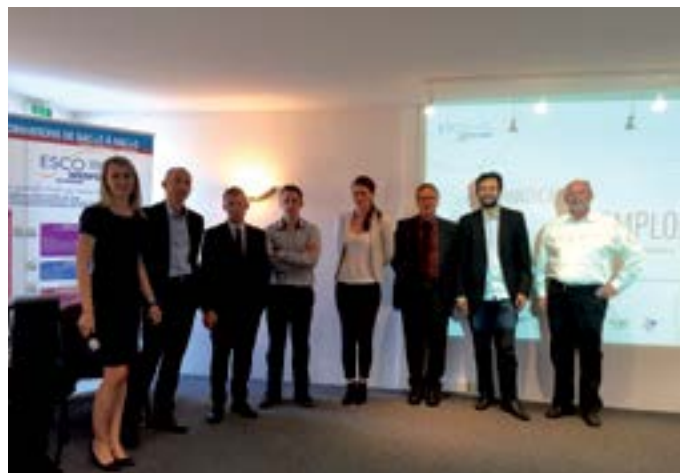
De nombreux experts du handicap et de l'emploi ont répondu présent

Cap'Handéo, label créé par l'association Handéo spécialisée dans les services à la personne, lance une grande opération participative intitulée « HanDUO » afin de valoriser le rôle des aidants professionnels dans l'insertion des personnes en situation de handicap, mais également le lien fort et unique qui les unit. Le point d'orgue de cette opération est une mini-série télé, dont les auxiliaires de vie sont les héros. Initialement prévue en juin sur France 3 Paris Île-de-France, elle sera finalement à l'antenne à l'automne 2015. Chaque soir et pendant quatre semaines, l'émission HanDUO mettra à l'honneur quatre duos formés d'une personne handicapée et de son aidant professionnel, qui partagent une passion unique ou vivent une histoire hors du commun.