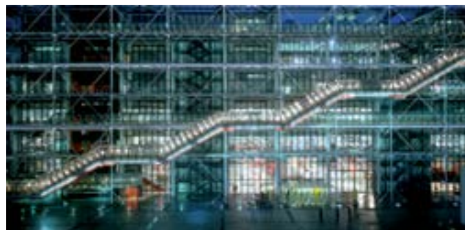
Le Centre Pompidou

AVANCEE ACTEURS CULTURE INCLUSION AVENIR HANDICAP EMPLOI SANTE INTEGRATION AUTONOMIE MALADIES EXPERTISE PARTAGE CITE ACCESSIBILITE DEPENDANCE SOLIDARITE DIFFERENCE CITOYENNETE CHRONIQUE ECHANGE PROJETS PSYCHIQUE DECIDEURS