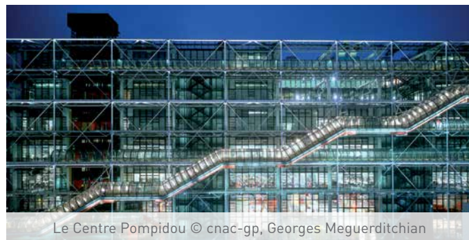
Le Centre Pompidou

AVANCEE ACTEURS CULTURE INCLUSION AVENIR HANDICAP EMPLOI SANTE INTEGRATION AUTONOMIE MALADIES EXPERTISE PARTAGE CITE ACCESSIBILITE DEPENDANCE SOLIDARITE DIFFERENCE CITOYENNETE CHRONIQUE ECHANGE PROJETS PSYCHIQUE DECIDEURS